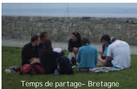
Temps de partage - Bretagne

Côte basque : camp 18-30 ans. Extrait du témoignage d'une des 18 participants : « L'alliance de la voile et de la retraite m'avait attirée comme un bon moyen de faire un break et de m'aérer le corps et l'esprit. La mer est un environnement très porteur où la création, et par elle la présence de Dieu, peut se palper. La vie en mer et la vie tout court sont très similaires, je ne m'en rendais pas compte avant de venir. Les images autour de la voile m'ont beaucoup parlées. J'ai été pas mal secourue par la retraite. Heureusement, ce temps débutait mes vacances et les a rendues plus fructueuses, tout en permettant de me sentir plus apaisée par rapport aux questions que le camp Vie en mer, entrée en prière a réveillées en moi. »