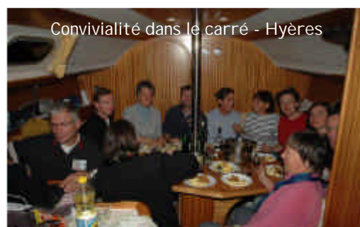
Convivialité dans le carré - Hyères

Toussaint : 30-50 ans. Les 3 bateaux, forts de 18 participants regroupés par âge (30, 40, et 50 ans), ont embarqué à Hyères pour un camp de 6 jours (soit 24 heures de plus que l'an dernier). Nous avons pu profiter doublement de la Méditerranée : non seulement l'eau était encore à bonne température pour se baigner, mais le vent était suffisamment présent pour que nous puissions nous amuser un peu. Les participants ont pu tout au long de ces 6 jours puiser dans les temps d'accompagnement individuels pour cheminer à la suite du Christ. De leur côté, les animateurs sont repartis très heureux de voir la fécondité du temps partagé.