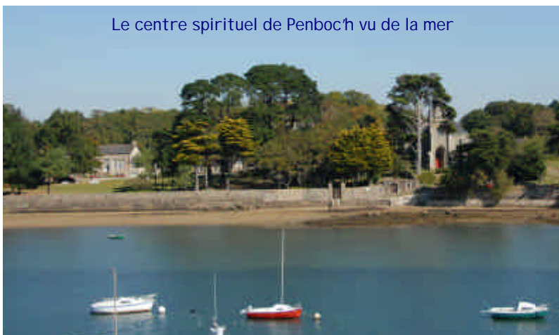
Le centre spirituel de Penboc'h vu de la mer

Outre les camps en mer, nous vous proposons une retraite de 5 jours pour vous initier à la prière, à l'accompagnement spirituel et à la relecture, tout en naviguant chaque jour sur des voiliers de 8 à 11 m. Vous êtes accueillis dans un site magnifique au bord de la mer : le centre spirituel de Penboc'h à Arradon dans le Golfe du Morbihan.